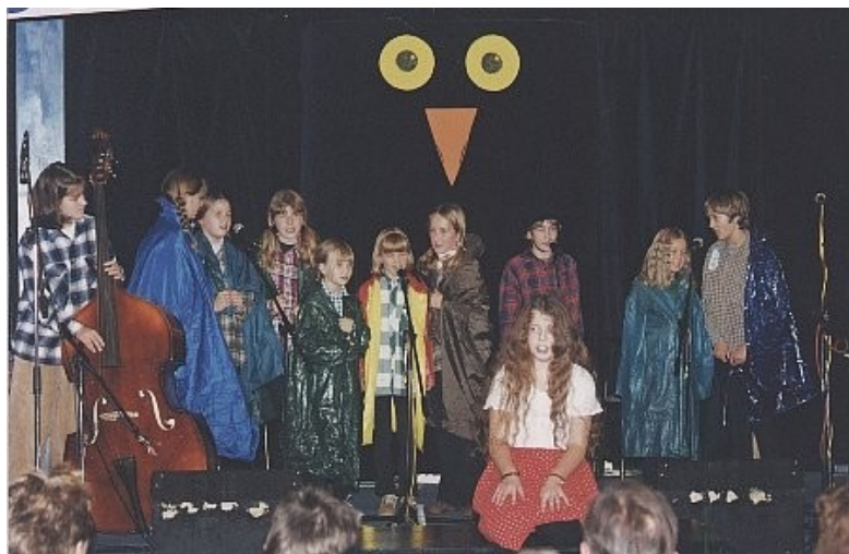
Foto z akce Jizerská sova. Skupina Schobydůbáci obsadila vynikající 3. místo

Tyto osobní aktivity neutichají a příští rok přibudou jistě další úspěšní členi. Zvyšování osobní kvalifikace vždy přináší zkvalitnění naší společné práce.