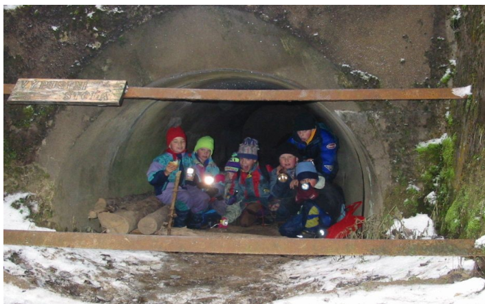
Vlčata na výletě na protržené přehradě

A je tu konec! Rodiče už venku čekají, my se loučíme pokřikem a za týden opět nashledanou!